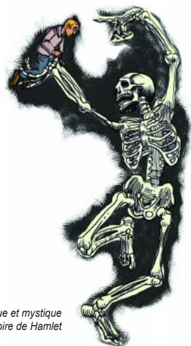
La Tragique et mystique histoire de Hamlet

Feydeau notre contemporain La Souris Verte de 10h à 17h Il y a un mystère Georges Feydeau et je vous propose d'enquêter. Pourquoi ce théâtre au contexte si daté parvient-il à nous faire rire, que parvient-il à nous dire ? C ie Astrov. Présentation publique le 15 avril. de 17 à 20 € 03 29 65 98 58 ► Scènes Vosges