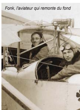
Fonck, l'aviateur qui remonte du fond