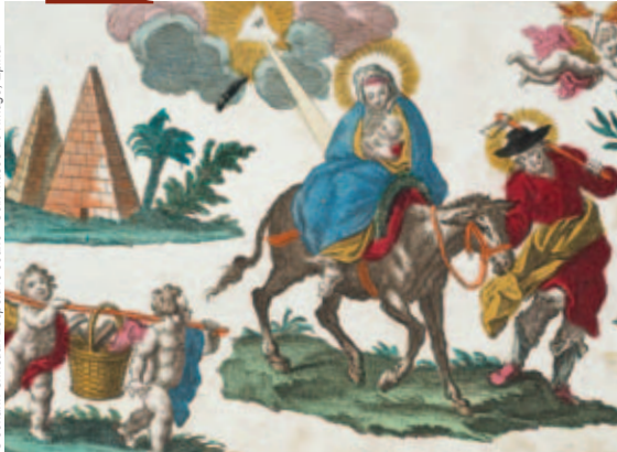
La Fuite en Égypte